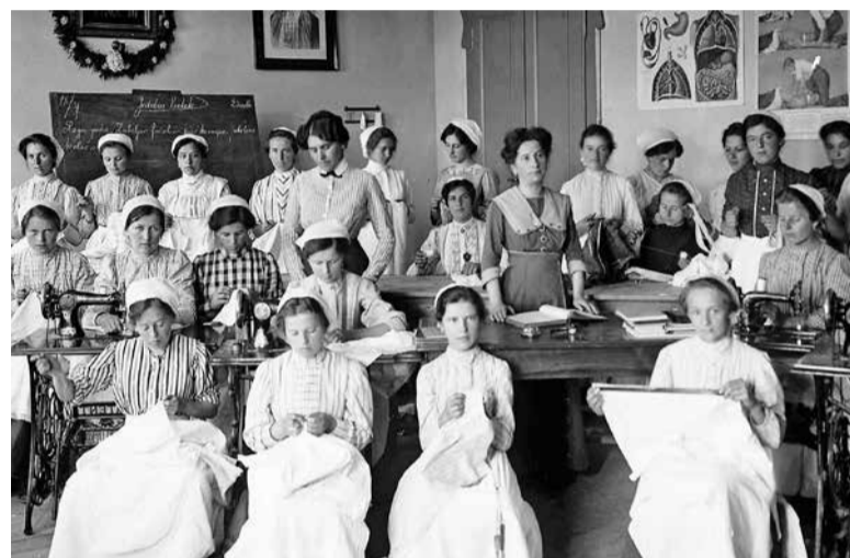
Gospodinjski tečaj v Društvenem domu v Domžalah, 1912.