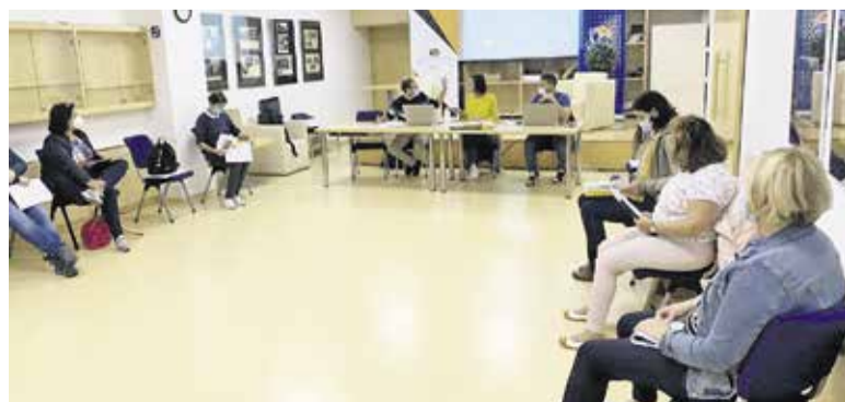
Delavnice priprave strateških podlag in akcijskega načrta v občini Domžale

OBČINA DOMŽALE