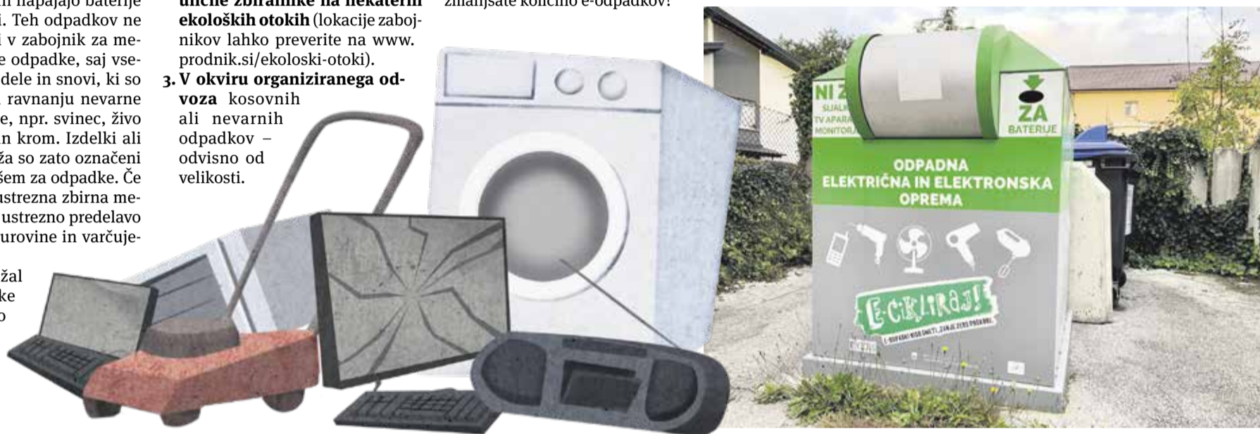
Manjše elektronske naprave in baterije lahko oddate tudi v posebne ulične zbiralnike na nekaterih ekoloških otokih.

OBČINA DOMŽALE IN JAVNO KOMUNALNO PODJETJE PRODNIK