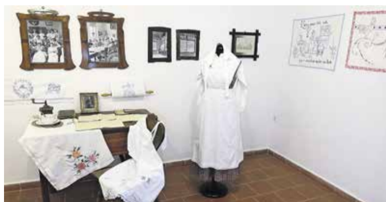
Detail z razstave v Menačenkovi domačiji

Kaj je lahko bolj preprosto kot prtič, obešen v delovnem okolju kuhinje z