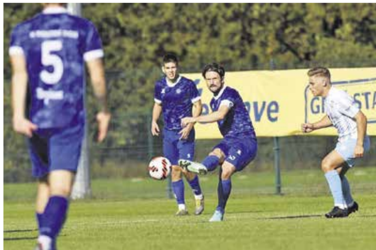
Dobljani bodo morali hitro najti pot iz krize, če želijo ostati za petami vodilnim.