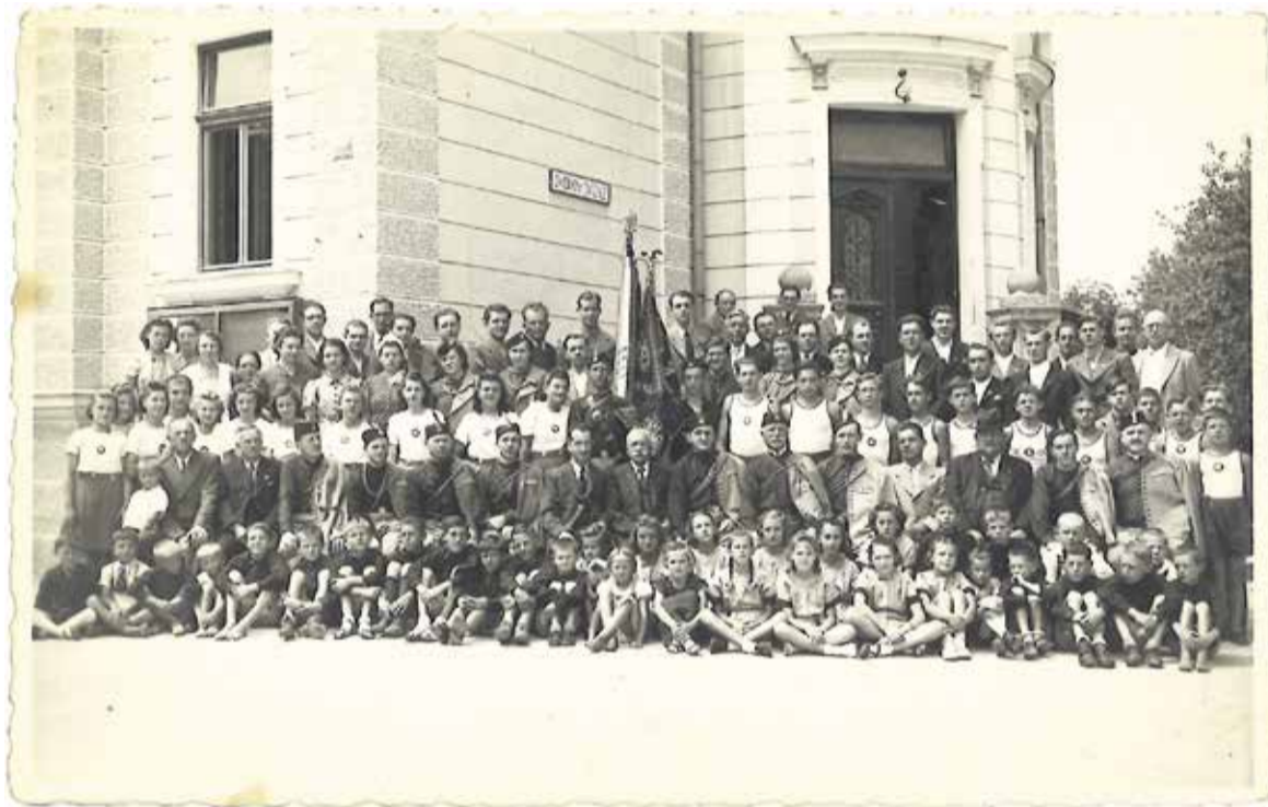
Vsi domžalski sokoli na enem posnetku iz leta 1940; to je zadnji posnetek članstva pred letom 1944, ko je bil 6. avgusta Sokolski dom požgan. Fotografijo objavljamo zato, ker na fasadi doma lahko opazite manjšo tablo z napisom Zvočni kino Domžale.

Sklenjeno je bilo tudi, da se bodo kino predstave v Sokolskem domu začele 7. ali 8. avgusta 1927; pač glede na to, da so dela s kinom končana.