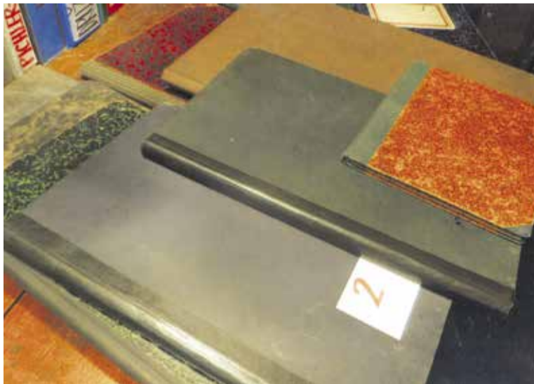
Sreči je zahvaliti, da še obstajajo skoraj vsi zapisniki o tem, kako je med letoma 1905 in 1911 delovalo Sokolsko društvo Domžale. Zaradi njih lahko objavljamo verodostojne podatke o zgodovini kina.

S poročilom o opravljenem delu se je novi predsednik Matej Turk pojavil že na naslednji seji 1. maja 1928: »Zavarovali smo kino in vso opremo za 20.000 DIN. Letno se plača 350 DIN zavarovalnine. Kar vodim kino blagajno (Turk je bil bivši blagajnik), je odplačanega 10.000 DIN kredita. Naš dolg se je od 37.000 DIN zmanjšal na 27.000 DIN. Pri Mestni hranilnici Ljubljana je še dolga za 23.500 DIN, ostalo je dolg, ki ga imamo do DOBA.« □