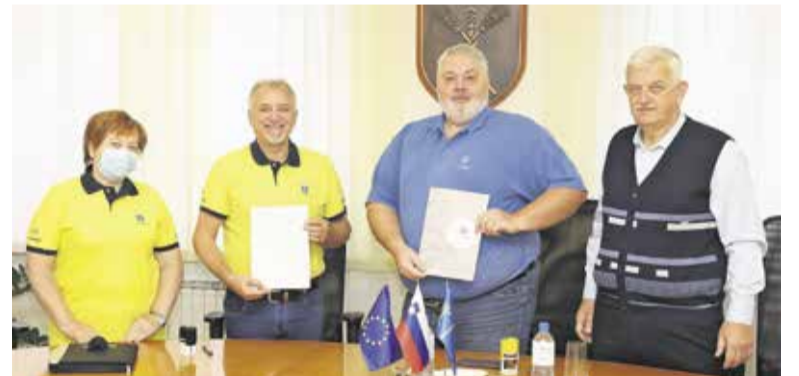
Podpis pogodbe z izbranim izvajalcem

Kdo lahko izvaja prevoz? Prevoz bo z zato namenjenim vozilom izvajal voznik prostovoljec. Vozniki niso strokovno usposobljeni za spremljanje invalidnih oseb. Vozniki upravičenca poberejo in odložijo na dogovorjeni točki, zanj ne opravljajo drugih opravkov.